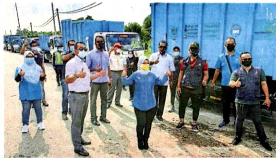
■市议会动用约30个大垃圾槽，才把垃圾清空。