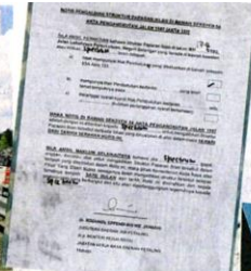
■工程局在违例广告牌张贴警告信，限定业者在14天内移除。