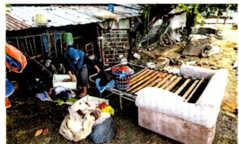
Keadaan rumah penduduk selepas banjir kilat di Kampung Segambut Bahagia Tambahan.