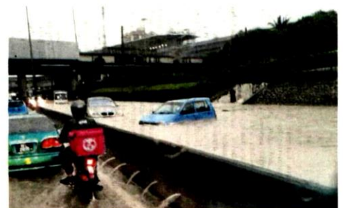
Banjir kilat di Jalan Kuala Selangor - Kepong dari Sungai Buloh menghala Damansara dekat susur Tol Sungai Buloh.