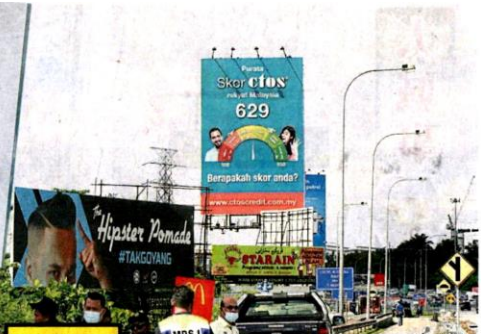
■市政厅与工程局将拆除设在联邦大道的20个违例广告牌。