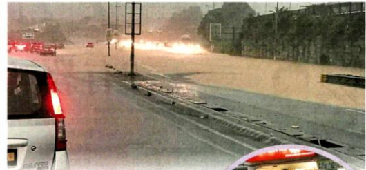
■万挠一带周二再发生水灾，交通一度受阻。