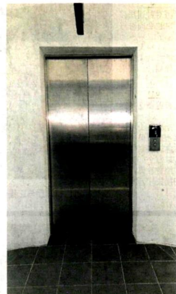
■A广场和C广场的4层泊车场终于有升降机！

“以后前来新镇的公众，可以直接开来泊车场，因为已经有升降机了，十分方便，不用在外兜来兜去找车位。”