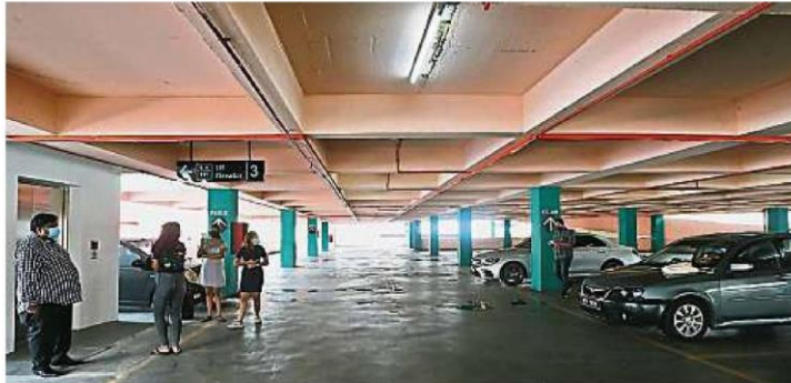
八打灵再也市政厅在A广场与C广场的多层停车场新设的电梯终于启用，方便民众使用。