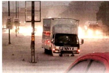
■水位高涨，罗厘也进退两难。