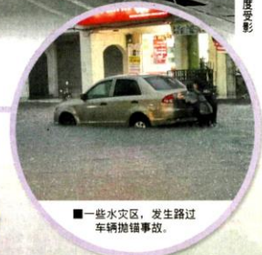
■一些水灾区，发生路过的车辆抛锚事故。