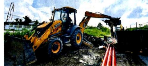
■市议会出动5辆神手，同步清理垃圾。