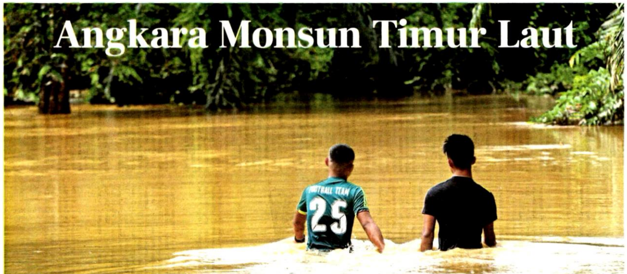
Penduduk meredah banjir ekoran hujan lebat di Kampung Bukit Nyoir, Pelong, Setiu.