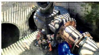
■万挠后街水泵处塞满垃圾，影响抽水功能。