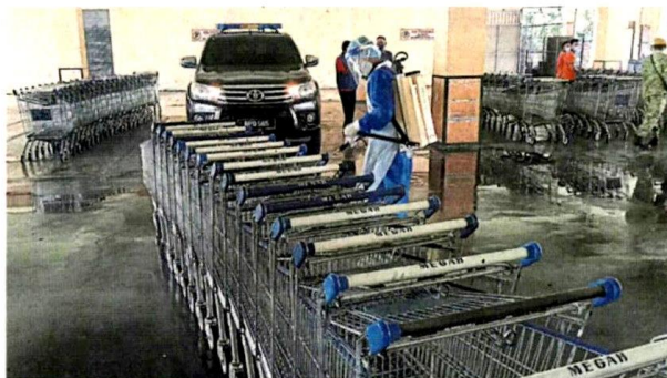
■超市的手推车没有放过,全部需要经过喷药消毒。

据了解,在冠病疫情仍在严峻期间,瓜冷市议会将继续在县内展开更多公共卫生与防疫消毒综合行动。