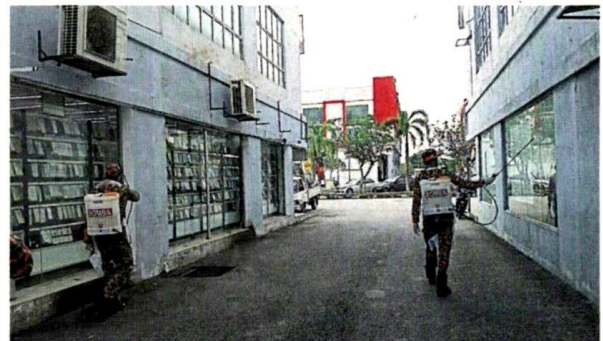
■消防人员参与消毒行动,为横巷两边的商店进行喷射消毒。