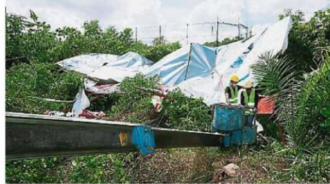
当局展开行动，拆除设置在联邦公路道路保留地上的违规广告牌，打击不法行径。

今日这项行动动员近100人，据悉也是该部首次展开类似的拆除非法广告牌行动，对付违规行径。